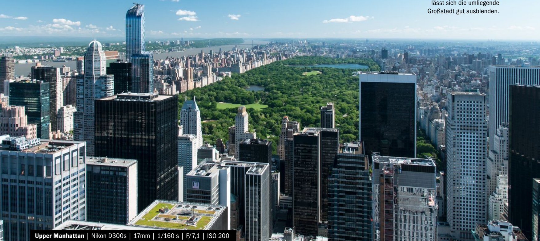
Upper Manhattan | Nikon D300s | 17mm | 1/160 s | F/7,1 | ISO 200

» Central Park: Die grüne Lunge der Stadt ist weit mehr als nur ein Park. Zwischen Bäumen und Grünflächen lässt sich die umliegende Großstadt gut ausblenden.